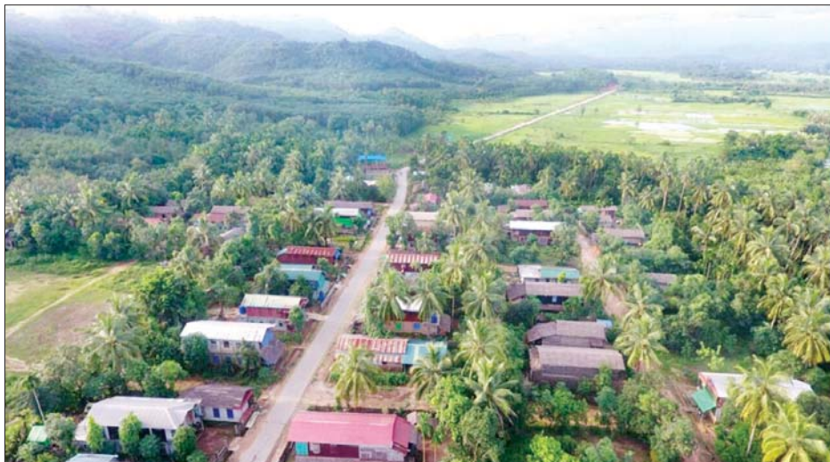
ရေးမြို့နယ် ကဗျာဝ - တရုတ်ထောက် ကတ္တရာလမ်း ဖောက်လုပ်ပြီးစီးမှုအား တွေ့ရစဉ်။

နေပြည်တော် စက်တင်ဘာ ၄ မွန်ပြည်နယ် ရေးမြို့နယ်အတွင်း ၂၀၁၉ - ၂၀၂၀ ဘဏ္ဍာနှစ်တွင် ဖောက်လုပ်ပြီးစီးခဲ့သော ကဗျာဝ - တရုတ်ထောက် ပင်လယ်ကမ်းခြေပတ် မြေသားလမ်း ၃ မိုင် ၄ ဖာလုံအနက် ၁ မိုင် ၄ ဖာလုံကို ၂၀၂၀ - ၂၀၂၁ ဘဏ္ဍာနှစ်တွင် ခွင့်ပြုရန်ပုံငွေကျပ် ၂၄၁ ဒသမ ၅၉၉ သန်းဖြင့် ကတ္တရာလမ်းအဖြစ် အဆင့်မြှင့်တင် ဆောင်ရွက်ခဲ့ရာ လုပ်ငန်းများ ရာနှုန်းပြည့် ဆောင်ရွက်ပြီးစီးပြီဖြစ်ကြောင်းနှင့် ကျန်ရှိသည့် မြေသားလမ်း ၂ မိုင်ကိုလည်း ဆက်လက် အဆင့်မြှင့်တင် ဆောင်ရွက်သွားမည်ဖြစ်ကြောင်း နယ်စပ်ဒေသနှင့်တိုင်းရင်းသားလူမျိုးများ ဖွံ့ဖြိုးတိုးတက်ရေးဦးစီးဌာန မွန်ပြည်နယ် ဖွံ့ဖြိုးမှုကြီးကြပ်ရေးရုံးမှ သိရသည်။ အဆိုပါလမ်းသည် ကဗျာဝကျေးရွာနှင့် တရုတ်ထောက်ကျေးရွာများရှိ အိမ်ထောင်စု ၄၆၅ စု၊ လူဦးရေ ၂၆၂၃ ဦးကို အကျိုးပြုလျက်ရှိကြောင်း သိရှိရသည်။