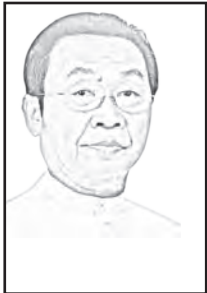
မောင်စာဂ

လွှတ်တော်ရွေးကောက်ပွဲများ ကျင်းပတော့မည်ဆိုလျှင် နိုင်ငံရေးပါတီများမှ လွှတ်တော်ကိုယ်စားလှယ်လောင်း များပါဝင်ယှဉ်ပြိုင်ကြသကဲ့သို့ တစ်သီးပုဂ္ဂလ လွှတ်တော် ကိုယ်စားလှယ်လောင်းများကလည်း ဝင်ရောက်ယှဉ်ပြိုင် ကြစေရမည်။ ဤတွင် တစ်သီးပုဂ္ဂလလွှတ်တော် ကိုယ်စားလှယ်လောင်းဆိုသည်မှာ အဘယ်နည်း။ ရွေးကောက်ပွဲတွင် တစ်သီးပုဂ္ဂလ လွှတ်တော် ကိုယ်စားလှယ်လောင်းများ ပါဝင်ယှဉ်ပြိုင်မှု အခြေအနေ မည်သို့ရှိသနည်း လေ့လာမိသည်။ အနှစ်ချုပ်၍ မျှဝေပါရ စေ။