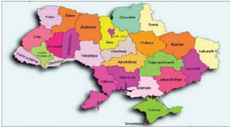
(ပုံ-၁) ယူကရိန်းနိုင်ငံ၏တည်နေရာပြမြေပုံ

နိုင်ငံတော်သမ္မတကခန့်အပ်သည်။ ယူကရိန်းနိုင်ငံ၏အစိုးရဝန်ကြီးများအဖွဲ့သည် နိုင်ငံတော်အုပ်ချုပ်ရေးကဏ္ဍတွင် အမြင့်ဆုံးအဖွဲ့အစည်းဖြစ်သည်။ ဝန်ကြီးချုပ် ဦးဆောင်သော အစိုးရဝန်ကြီးများအဖွဲ့ (Cabinet of Ministers) တွင် ဒုတိယဝန်ကြီးချုပ် ၁ ဦးပါဝင်သည်။ ယူကရိန်းနိုင်ငံတွင် ခရိုင်မီးယားကိုယ်ပိုင်အုပ်ချုပ်ခွင့်ရဒေသ (Autonomous Republic of Crimea) တစ်ခု၊ ပြည်နယ် (Oblast)