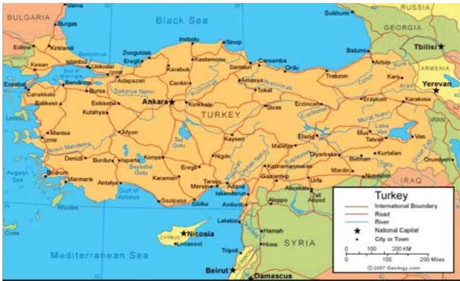
တူရကီနိုင်ငံ၏အုပ်ချုပ်မှုနယ်မြေများပြမြေပုံ

နိုင်ငံတော်အကြီးအကဲနှင့် နိုင်ငံတော်အုပ်ချုပ်ရေးအကြီးအကဲသည် နိုင်ငံတော်သမ္မတဖြစ်သည်။ နိုင်ငံတော်သမ္မတသည် လိုအပ်ပါက ဥပဒေပြုနှစ်၏ ပထမနေ့တွင် လွှတ်တော်၌ မိန့်ခွန်းပြောကြားနိုင်သည်။ နိုင်ငံတော်သမ္မတသည် နိုင်ငံခြားရေးမူဝါဒ၊ နိုင်ငံတော်၏မူဝါဒများကို လွှတ်တော်တွင် မိန့်ခွန်းပြောကြားခွင့်၊ သဝဏ်လွှာပေးပို့ခွင့်ရှိသည်။ နိုင်ငံတော်သမ္မတသည်ပြည်ထောင်စုအစိုးရအဖွဲ့၏ အကြီးအကဲဖြစ်ပြီး ဒုတိယသမ္မတအပါအဝင် ပြည်ထောင်စုအစိုးရဝန်ကြီးများအား ခန့်အပ်ခြင်း၊ တာဝန်မှရပ်စဲခြင်းများ ဆောင်ရွက်နိုင်သည်။ နိုင်ငံ