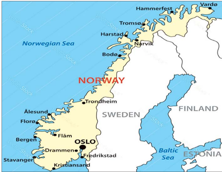
နော်ဝေနိုင်ငံ၏ တည်နေရာပြမြေပုံ

ဖွဲ့စည်းရန် နိုင်ငံတော်ကောင်စီသို့ အဆိုပြုခဲ့သော လည်း Lagting (အထက်လွှတ်တော်) ထံမှ ပူးပေါင်းရန်အတွက် သဘောတူညီမှု မရရှိခဲ့ပေ။ သို့သော် ၂၀၀၉ ခုနှစ် အထွေထွေရွေးကောက်ပွဲအတွက် ၂၀၀၇ ခုနှစ် ဖေဖော်ဝါရီလတွင် Lagting (အထက်လွှတ်တော်) ကို ဖျက်သိမ်းပြီး ပါလီမန်တစ်ခုတည်း ပူးပေါင်းရန်အတွက် ဖွဲ့စည်းပုံအခြေခံဥပဒေပြင်ဆင်ရေးကို အတည်ပြုခဲ့သည်။