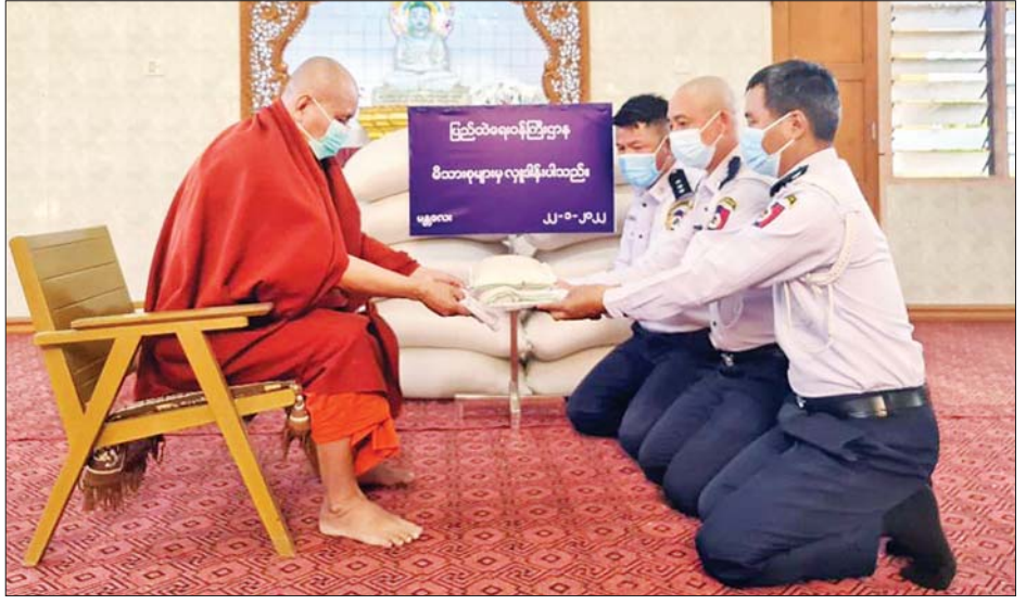
ပြည်ထဲရေးဝန်ကြီးဌာန တပ်ဖွဲ့ / ဦးစီးဌာနများမှ တာဝန်ရှိသူများက မြစ်ကြီးနားမြို့နှင့် မန္တလေးမြို့တို့ရှိ ဆရာတော်၊ သံဃာတော်များအား ဆွမ်းဆန်တော်များ ဆက်ကပ်လှူဒါန်းစဉ်။