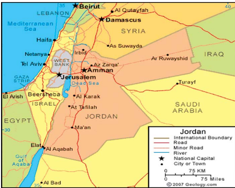
ဂျော်ဒန်နိုင်ငံ၏တည်နေရာပြမြေပုံ။

ဂျော်ဒန်နိုင်ငံသည် အရှေ့အလယ်ပိုင်းဒေသတွင် တည်ရှိပြီး အရှေ့ဘက်နှင့် တောင်ဘက်တွင် ဆော်ဒီအာရေဗျ၊ အရှေ့မြောက်ဘက်တွင် အီရတ်၊ မြောက်ဘက်တွင် ဆီးရီးယား၊ အနောက်ဘက်တွင် အစ္စရေးနှင့် ပါလက်စတိုင်းတို့နှင့် နယ်နိမိတ်ချင်း ထိစပ်လျက်ရှိသည်။ စုစုပေါင်းဧရိယာ စတုရန်းကီလိုမီတာ ၈၉၃၄၁ (၃၄၄၉၅ စတုရန်းမိုင်)ကျယ်ဝန်းပြီး မြို့တော်အမ္မန် (Amman) မှာ ဂျော်ဒန်နိုင်ငံ၏ အကြီးဆုံးမြို့ဖြစ်ပြီး စီးပွားရေး၊ နိုင်ငံရေးနှင့် ယဉ်ကျေးမှု အချက်အချာကျသောမြို့လည်းဖြစ်သည်။ ၂၀၂၁ ခုနှစ် သန်းခေါင်စာရင်းအရ လူဦးရေ စုစုပေါင်းမှာ ၁၁ သန်းခန့်ရှိ၍ အများစုမှာ ဆွန်နီ မွတ်စလင် (Sunni Muslims) လူမျိုးများဖြစ်ပြီး လူနည်းစုမှာ ခရစ်ယာန်ဘာသာဝင် (Christians) လူမျိုးများဖြစ်ကြသည်။ အာရပ်နိုင်ငံများထဲမှ ၁၁ ခုမြောက် လူဦးရေအများဆုံးနိုင်ငံဖြစ်ပြီး လူဦးရေ တစ်သန်းကျော်မှာ အမ္မန် (Amman) မြို့တော်တွင် နေထိုင်ကြသည်။ ဘုရင်မှ ခန့်အပ်ထားသည့် အုပ်ချုပ်ရေးမှူးများအား ဆောင်သည့် ပြည်နယ် ၁၂ ပြည်နယ်နှင့် ယင်းအောက်တွင် ခရိုင်၊ ခရိုင်ခွဲ၊ မြို့နယ်၊ မြို့၊ ရွာများဖြင့် ဖွဲ့စည်းထားသည်။