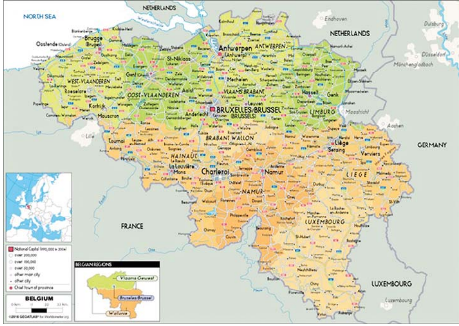
ဘယ်လ်ဂျီယံနိုင်ငံ၏ တည်နေရာပြမြေပုံ

သန်းကျော် မှီတင်းနေထိုင်လျက်ရှိပြီး ပြင်သစ်ဘာသာစကား၊ ဂျာမန်ဘာသာစကားနှင့် ဒတ်ချ်ဘာသာစကားတို့ကို ရုံးသုံးဘာသာစကားများအဖြစ် အသုံးပြုလျက်ရှိပါသည်။ ငွေကြေးအားဖြင့် ယူရိုငွေကြေးကို သုံးစွဲပါသည်။ ခရစ်ယာန်ဘာသာကိုးကွယ်သူ ၆၀ ရာခိုင်နှုန်း၊ ဘာသာမဲ့ ၃၁ ရာခိုင်နှုန်း၊ အစ္စလာမ်ဘာသာကိုးကွယ်သူ ၃ ရာခိုင်နှုန်းနှင့် အခြားဘာသာကိုးကွယ်သူ နှစ်ရာခိုင်နှုန်းတို့မှီတင်းနေထိုင်လျက်ရှိပါသည်။ ဘယ်လ်ဂျီယံနိုင်ငံသည် အခြားနိုင်ငံများမှ ရွှေ့ပြောင်းလုပ်သားများကို အမြဲကြိုဆိုလက်ခံလျက်ရှိသောကြောင့် အရောင်အသွေးစုံလင်လှသောလူမျိုးများ အတူယှဉ်တွဲနေထိုင်လျက်ရှိသောနိုင်ငံတစ်နိုင်ငံလည်း ဖြစ်ပါသည်။